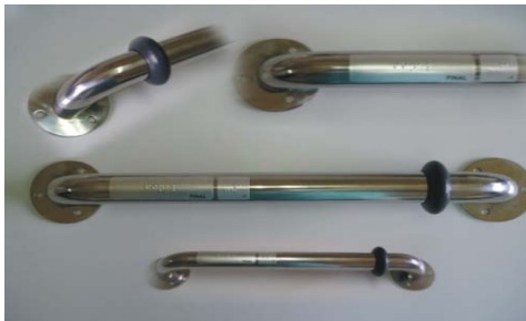
Foto Anel de borracha ref. BB-0320 e placas em Braille ref. BB-0330

Borindus Borrachas Industrias Comercial Ltda.